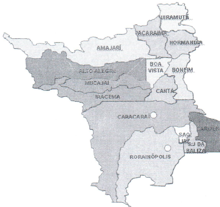
MAPA DO ESTADO DE RORAIMA

A regionalização orienta a descentralização das ações e serviços e potencializa os processos de pactuação e negociação entre gestores. Seu avanço depende, porém, da construção de desenhos regionais que respeitem as realidades locais, estabelecendo os Colegiados de Gestão Regional – CGRs como espaços ativos de co-gestão.