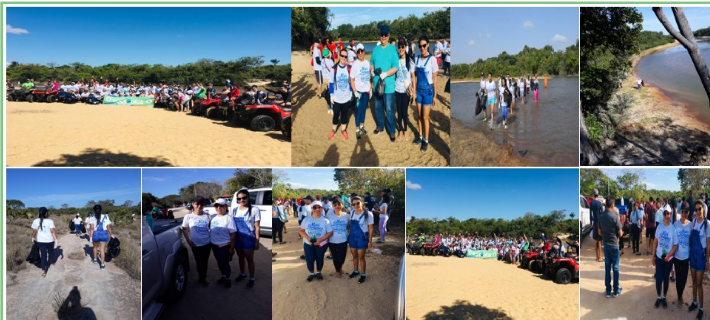
Figura 01: Participação do Departamento de Vigilância Ambiental na Caminhada Ecológica.

A ação com saída da praia do Caçari, com chegada na Praia da Polar onde reuniu 120 voluntários entre colaboradores da companhia e integrantes de instituições civis e militares e entre elas este Departamento de Vigilância em Saúde Ambiental—DVA. Ao todo foram retirados cerca de 300 quilos de resíduos sólidos do meio ambiente.